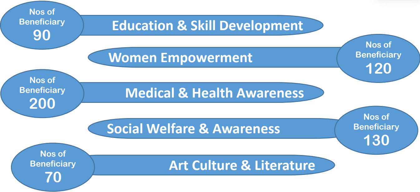
Project Wise Financial Impact for the FY_2023-24