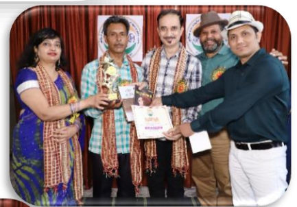
गुस्ताख हिंदुस्तानी-दिल्ली तृतीय पुरस्कार